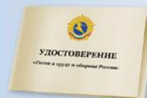
UD6 Размер: 70х100 мм Плотная бумага