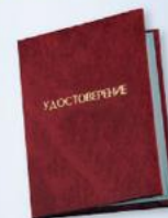
UD4 Размер: 110х80 мм Бумвинил, плотная бумага

ФУТЛЯРЫ ДЛЯ ЗНАКОВ «ГОТОВ К ТРУДУ И ОБОРОНЕ»