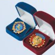
FU125a (бордо) FU125b (синий) Внут. размер: 45х42 мм

ПОДЛОЖКА В УПАКОВКЕ ДЛЯ ЗНАКОВ «ГОТОВ К ТРУДУ И ОБОРОНЕ»