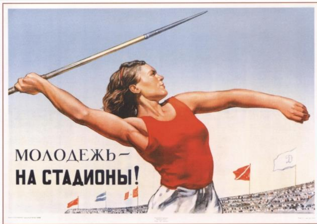
504. Голованов Л. Молодежь — на стадионы! 1947

С 2010 года программа начала свое возрождение.