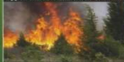
МОЖЕТ ПОГУБИТЬ ВЕСЬ ЛЕС